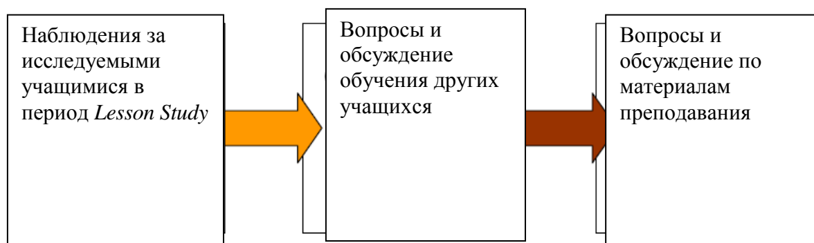
Рис. 3. Схема обсуждения после Lesson Study

Нижеследующий образец может быть использован для записи обсуждения по итогам урока