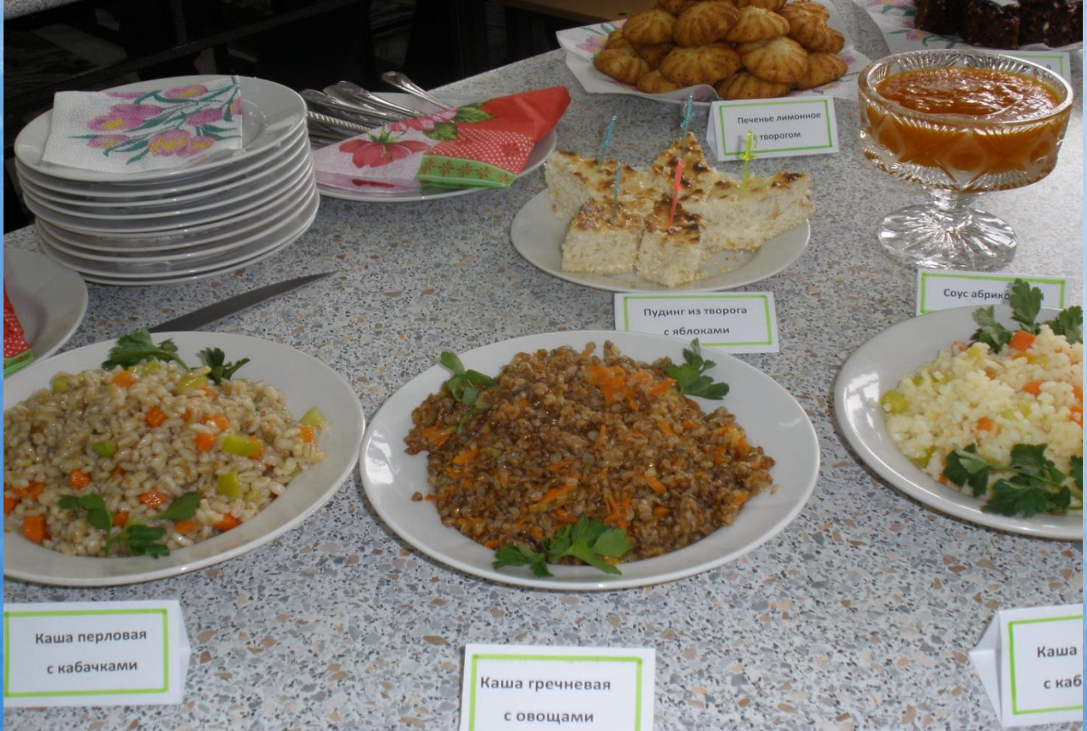
Каша перловая с кабачками